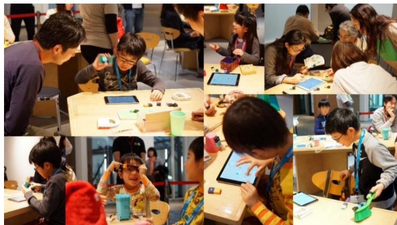
これまでに開催した MESH ワークショップの様子

MESH タグは、それぞれ動きセンサー/ライト/ボタン/明るさセンサーなどのさまざまな機能を持ち、無線で MESH アプリとつながることができます。MESH アプリ上でこれらのタグを連携させ、自分で考えたアイデアがかんたんに実現できます。