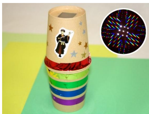
虹色きらきらスコープ