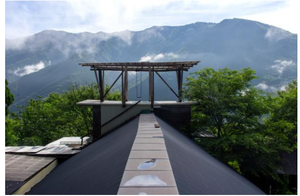
絶景の空中ブランコ