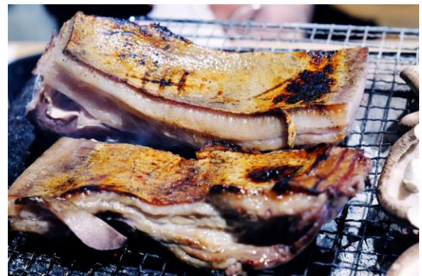
炭火で焼き上げる猪肉