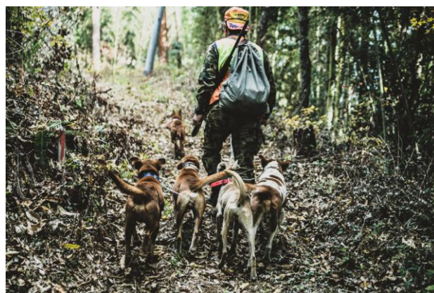
猪鹿狩りに向かう猟師と猟犬