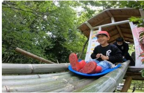
森の遊園地で遊ぶ子供たち