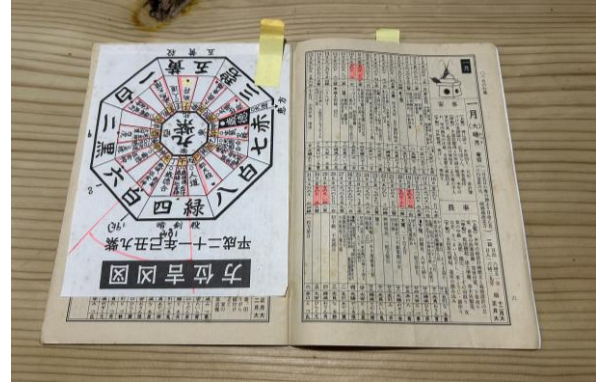
猟師が守る掟「さかめぐり」