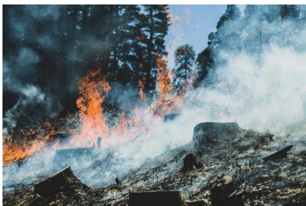
世界農業遺産に登録されている焼畑農法

椎葉村の暮らしや文化に触れることを通じて、一人ひとりが自然との関わりや自らの生き方を見つめ直し、これからの里山の暮らしや豊かさをともに模索する機会を創出していきます。