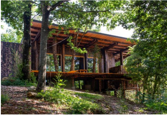
里山に佇む「里山遊楽」