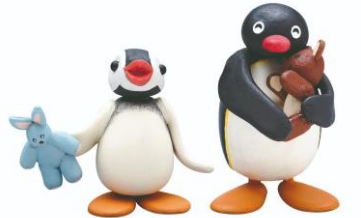
貴重なクレイモデルも展示 ※画像はイメージです

実際のアニメーション制作で使用された、貴重なクレイモデルや初期スタジオの記録・絵コンテなどの制作資料等の展示を通して、ペンギーのストーリーや登場するキャラクターに触れることで、作品の原点を感じてもらうことができます。また、アニメでおなじみの「ペンギーの家」をイメージしたフォトスポットも登場。ペンギーの物語に入り込んだような没入体験をお楽しみいただけます。