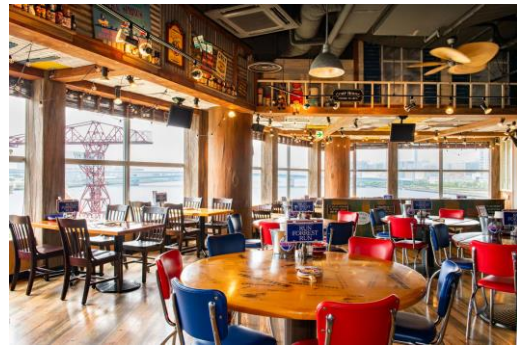
ららぽーと豊洲店