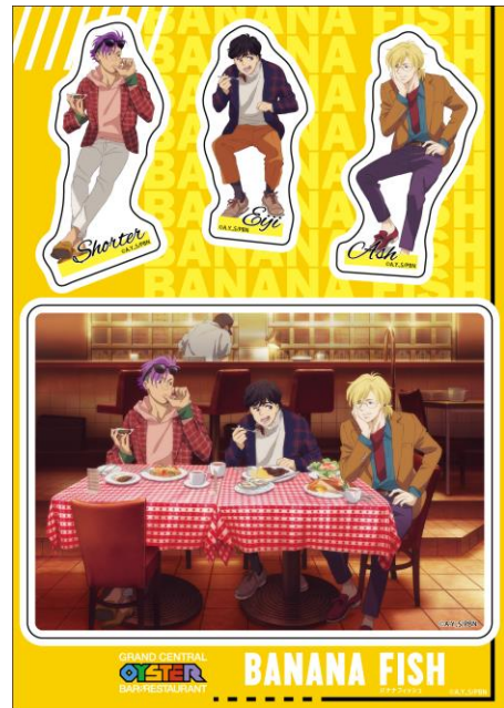
オリジナルステッカー