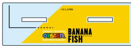
オリジナルアクリルスタンド