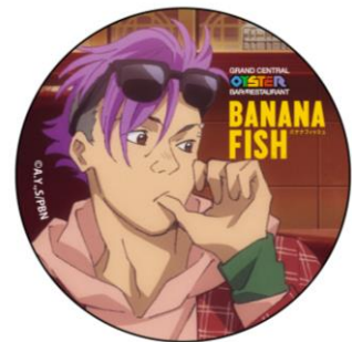
オリジナル缶バッジ ショーター Ver.