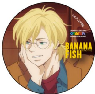
オリジナル缶バッジ アッシュ Ver.