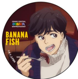
オリジナル缶バッジ 英二 Ver.