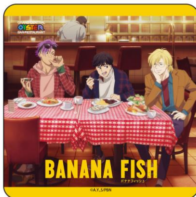
オリジナルコースター