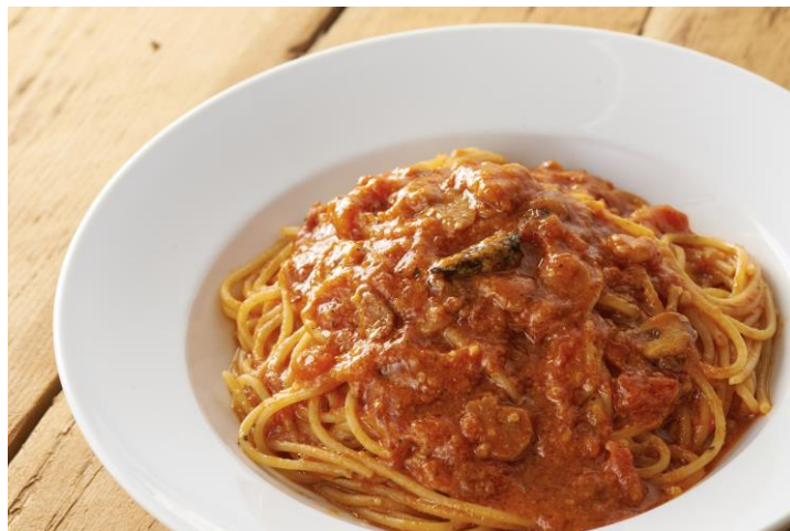
トマトとニンニクのスパゲティ

イタリアのマンマの味を思い出させるこの味を求めて、3世代で通うファンもいるほどの、40年以上愛されている看板メニューをぜひ堪能ください。