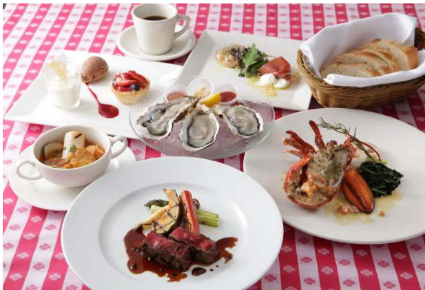
2016 Precious Christmas Dinner

これらは、同期間中に開催される品川駅のショッピングセンター「アトレ品川」のレストランキャンペーン「Precious Christmas」への参加メニューとして提供するもので、年末の大イベント「クリスマス」のカップル・ご夫婦でのお食事や、年末の仲間との集まりをイメージして作られた特別メニューです。