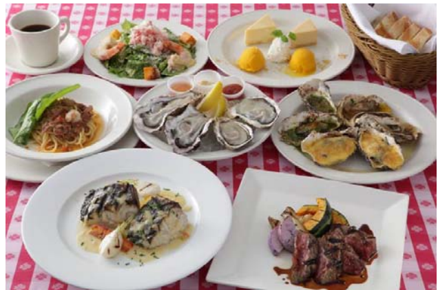
“グラセン”パーティー