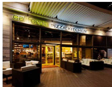
「カリフォルニア・ピザ・キッチン」ラゾーナ川崎店