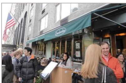
NY アッパーウエスト店