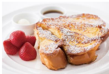
代表メニュー フラッフィーフレンチトースト