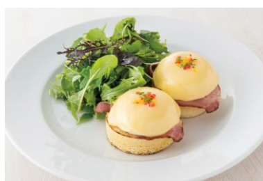
代表メニュー クラシックエッグベネディクト