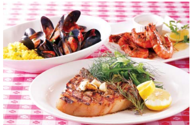
SUMMER DINNER メニュー3種