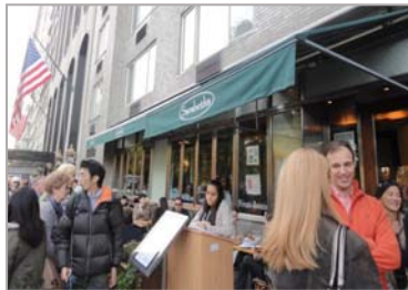
NY アッパーウエスト店