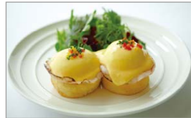
代表メニュー クラシックエッグベネディクト