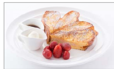
代表メニュー フラフイーフレンチトースト