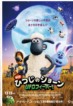
2019 Aardman Animations Ltd and Studiocanal SAS. All Rights Reserved.