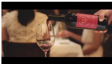
ウルフギャング・ステーキハウス オリジナルのワイン