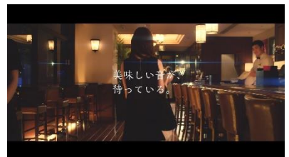
極上のステーキを堪能し お店を後にする女性