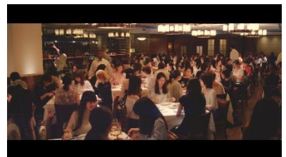
極上のステーキを前に 笑顔が溢れる店内