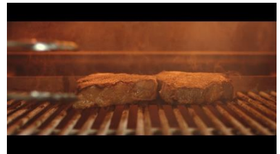
普段は見るできない ステーキが焼かれているシーンも