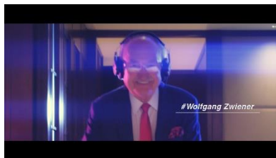
ズウィナー氏がDJとして登場！