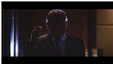
“謎の人物”の合図とともに 音楽がスタート