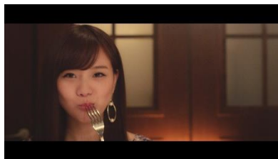
軽快なテンポでステーキ(素敵)な 女性が次々と登場