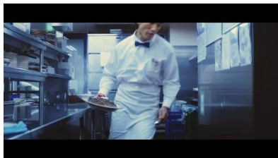
オーダーが入りステーキをサーブする 臨場感溢れるシーンは必見