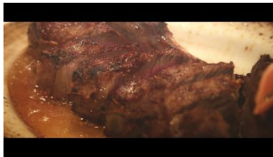
これぞ“ウルフギャング” というステーキはまさに飯テロ！