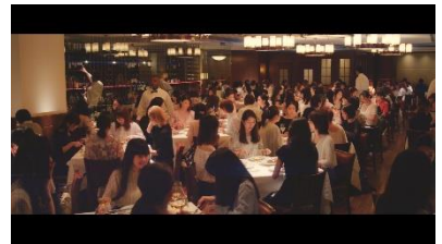
100人の女性で埋め尽くされた 店内は大盛り上がり