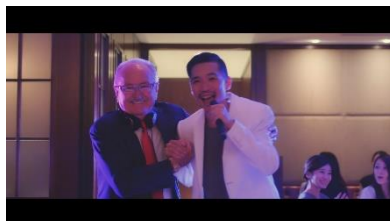
ズウィナー氏とZeebraさんの共演で パーティーの熱気は最高潮！