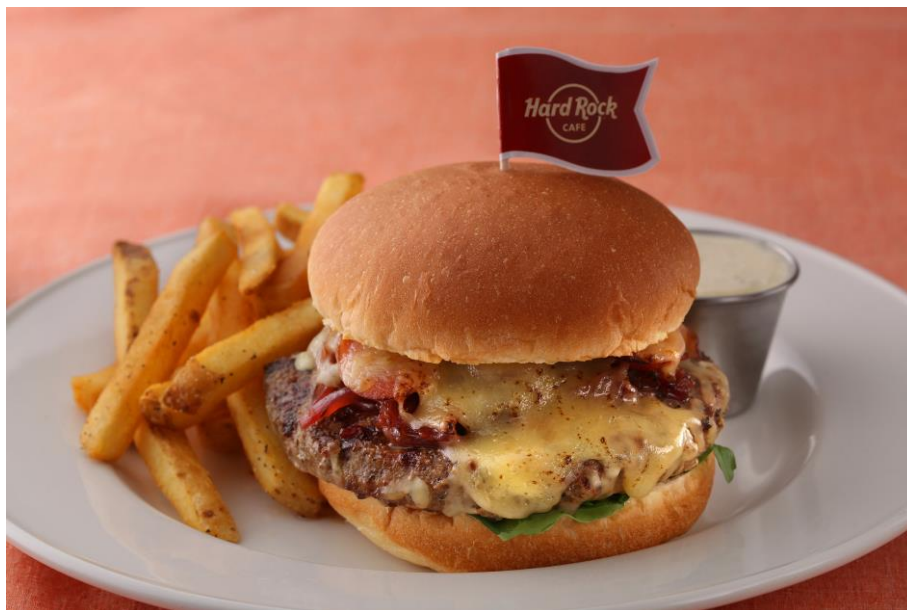
Double Dutch Burger 2,180円・税別

さらに期間中、「ゴッホ展 巡りゆく日本の夢」の半券を上野駅東京店でご提示いただくと、お会計から10%割引サービスが適用されます。（※割引サービスのご利用注意点はハードロックカフェ公式HPにてお知らせします。）