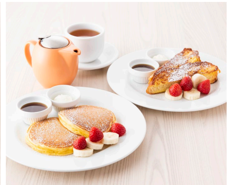
「スウィートディナー ハーフセット」

平日モーニングタイム（9：00～10：30LO）に登場するのは「ランバージャック モーニングセット」（1,450円・税別）。お好きな卵料理（スクランブルエッグまたは目玉焼き）グリルベーコン、サラダ、ミニ・バターミルクパンケーキをワンプレートにし、ミニスープ、コーヒー又は紅茶をセットにした、朝のパワーチャージにぴったりなセットメニューです。