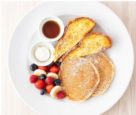
「ハーフ&ハーフ シグニチャープレート」