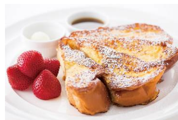
代表メニュー フラッフィーフレンチトースト