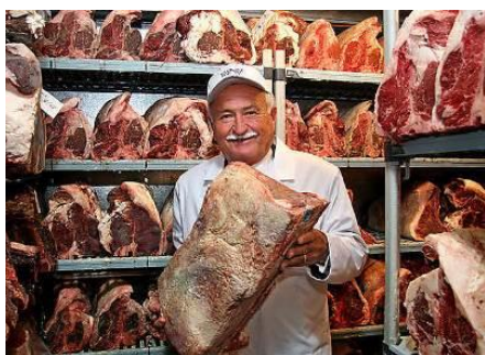
創業者 ウルフギャング・ズウィナー

「ウルフギャング・ステーキハウス」では、米国農務省が最上級品質“プライムグレード”に格付けした希少な牛肉のみを使用。冷凍せずにチルドで仕入れた肉を 28 日間、店内の専用熟成庫で一定の温度・湿度管理によりドライエイジング。長期乾燥熟成によって旨味と柔らかさが増した赤身肉を厚切りにして、900℃のオーブンで一気にお皿ごと焼き上げ、お客様のテーブルまでそのままサーブします。