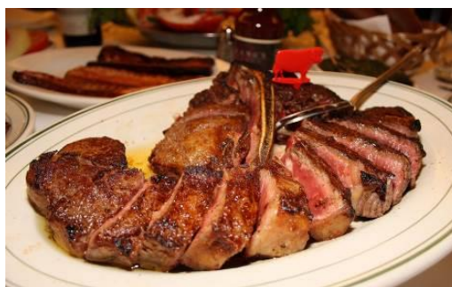
プライムステーキ(2名様用)