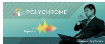
AI技術を活用し、企業の強みを可視化・分析・発信することで、課題解決へ導く「VisionVoice (ヴィジョンボイス)」。そのコンテンツのひとつ「TopVoice (トップボイス)」は、経営者の理念をロングインタビューで語り下げ、企業の強みを言語化するサービスです。

—経営者のビジョンを社内外コミュニケーションに活用 熟練編集者による経営者への長時間インタビューを通じて、創業の背景、経営理念、ビジョン、ミッション、バリュー、コア・コンピタンスを整理。企業の「らしさ」を言語化します。社内への理念浸透はもちろん、採用、広報、IR など様々な場面で活用できます。