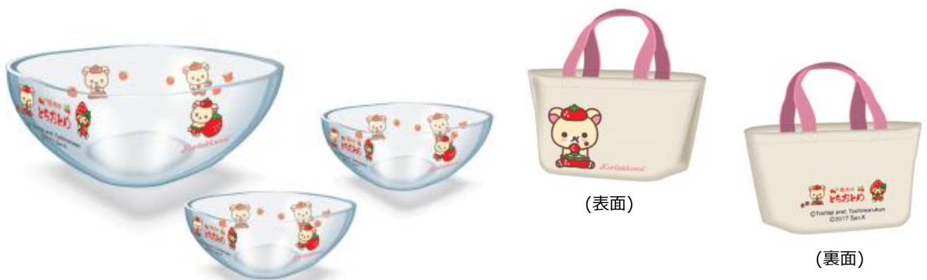
<A賞>コリラックマ ガラスボウル (大・小3個セット) 150名様