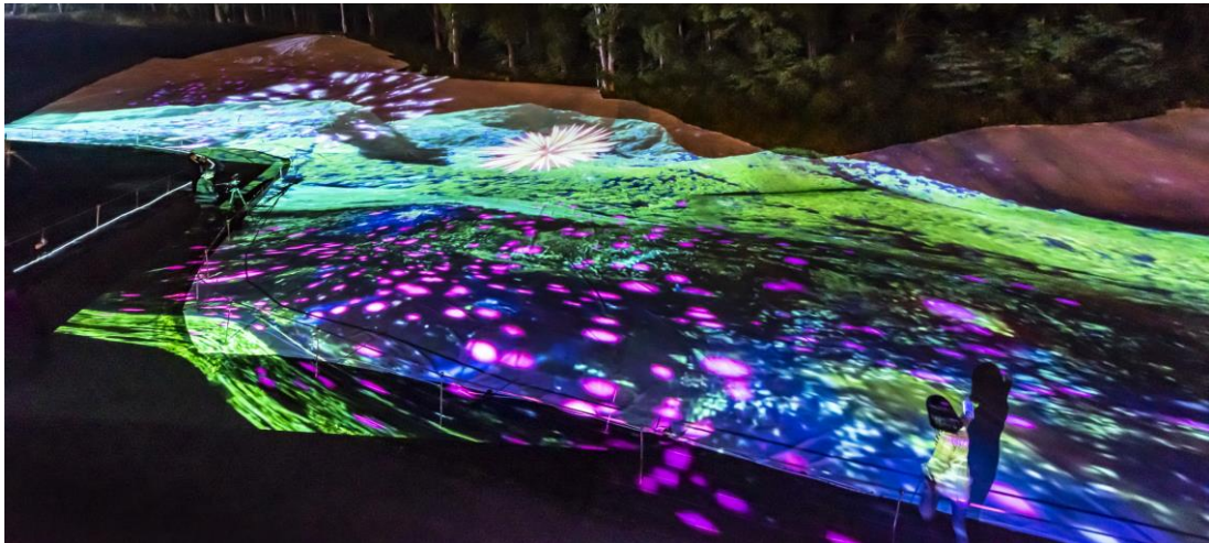
デジタル絶景絵巻～花火編～

今シーズンで6年目の開催となる同イベントは、11月17日（日）をもってグランドフィナーレを迎える。旧ゴルフコースの広大なグラウンドに展開する世界初の3Dによるグラウンドプロジェクションマッピング&オーロラショーが目玉のコンテンツだが、11月1日（金）から11月17日（日）までの17日間は、シーズン中に展開されたプロジェクションマッピングのスペシャルコンテンツ映像が全て展開される。コンテンツ映像は「絶景」をテーマとしており、天空のオーロラショーとアーティストイックな技法が一体となった、壮大な異世界への没入体験を味わえる。