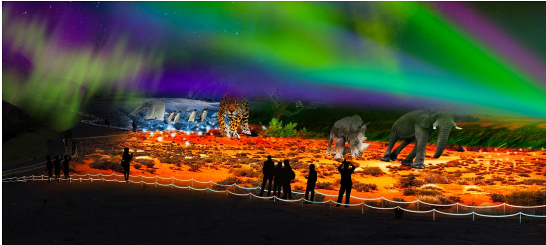
デジタル絶景絵巻～サファリ編～