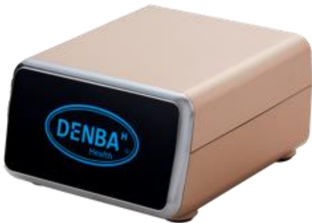
『グッドスリーププラン』にて使用するトータルボディコンディショニングシステム DENBA Health

アパホテル&リゾート〈大阪梅田駅タワー〉公式HP https://www.apahotel.com/hotel/kansai/osaka/osaka-umeda-eki-tower/