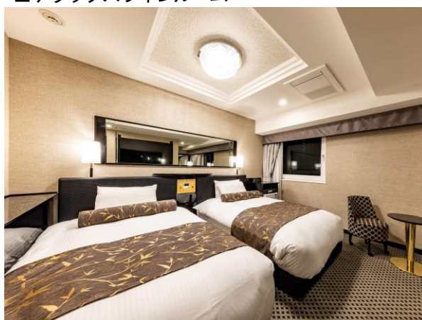
■デラックスツインルーム