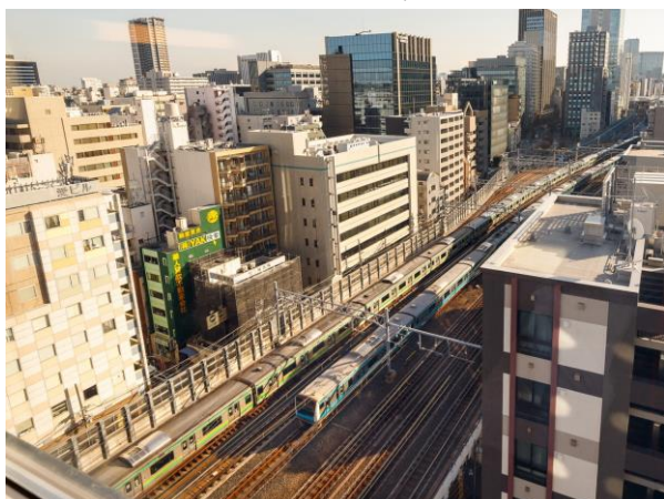
■トレインビュールームからの眺望