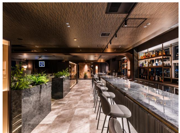
バーカウンター（13 席）