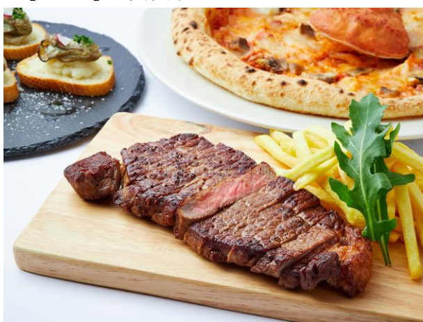
豪州産牛ロースの炭火オイル焼き