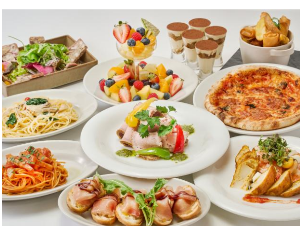
【パーティプラン】17CLUB イタリアンプラン