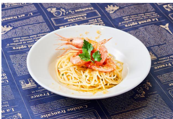
【パスタ】北国甘海老のアーリオ エ オーリオ