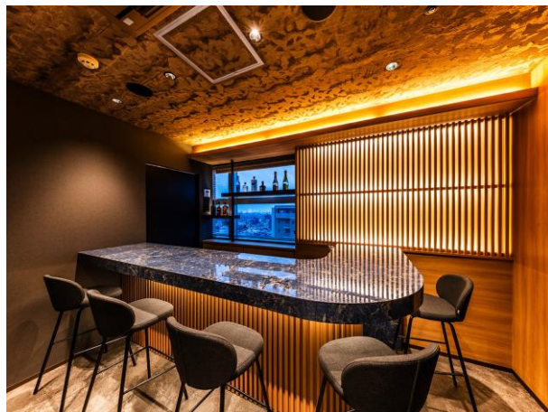
プライベート個室バーカウンター