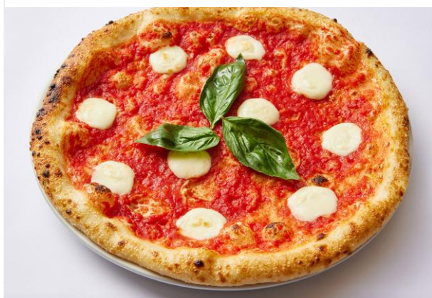
【ピッツァ】ピッツァ・マルゲリータ