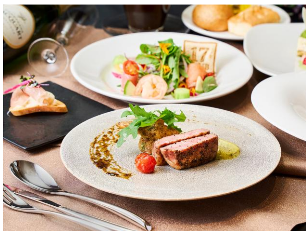
【コース】能登牛ステーキコース