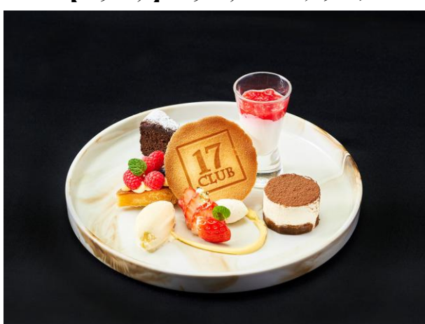
ドルチェミスト（盛り合わせ）5種