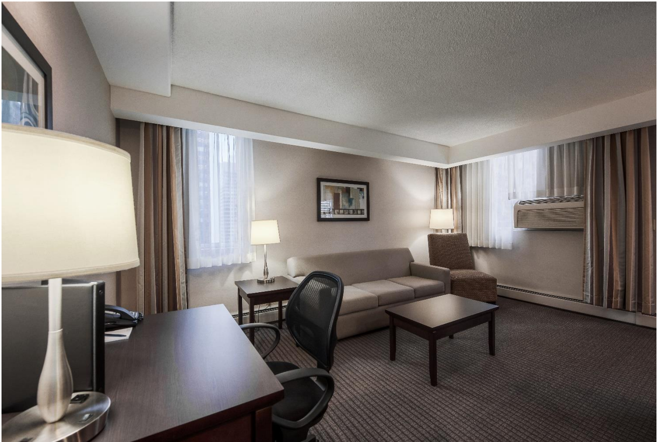
【客室・キッチンエリア】