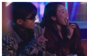
人生を謳歌してきた自分の姿を思い出す①