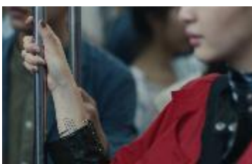
徐々に年齢が気になってくる