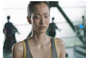
年齢に対して葛藤が募る