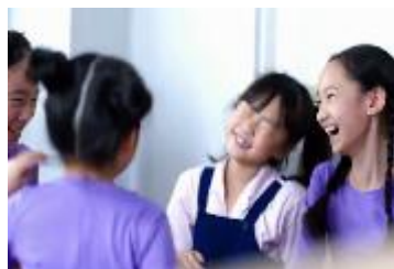
幼い頃は気にならなかった年齢