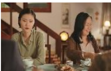
親からのプレッシャーや、