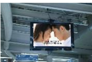
結婚を急げという広告