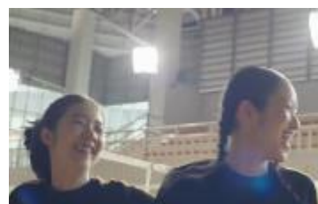
人生を謳歌してきた自分の姿を思い出す②