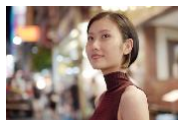
自信を持って前に進んでいく決断をする