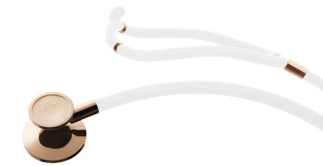
Champagne Gold 48,000円