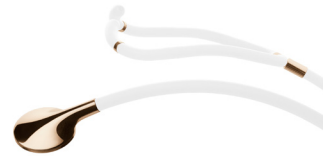
Champagne Gold 43,000円