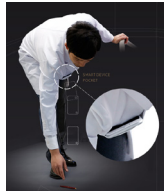
東京慈恵会医科大学