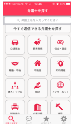
【①相談カテゴリ選択画面】