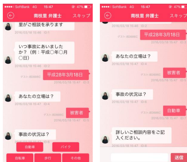
【自動質問チャット画面】

式」「自由入力形式」で簡単に答えることができる機能となります。 これにより、相談はしたいけどまず何から伝えたらいいかわからないといった相談者の問題を解決し、弁護士は最低限の情報を持った状態から相談を開始することができるため効率的に相談を進めることが可能となります。