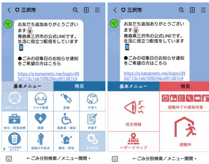
三沢市 LINE 公式アカウント QR コード