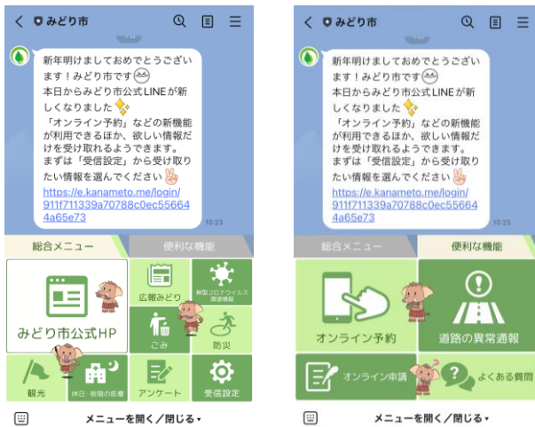
みどり市 LINE 公式アカウントのリッチメニュー