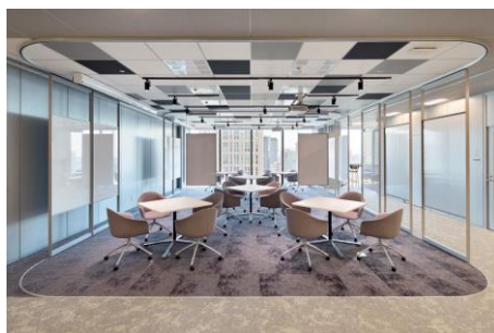
フリーワークエリア