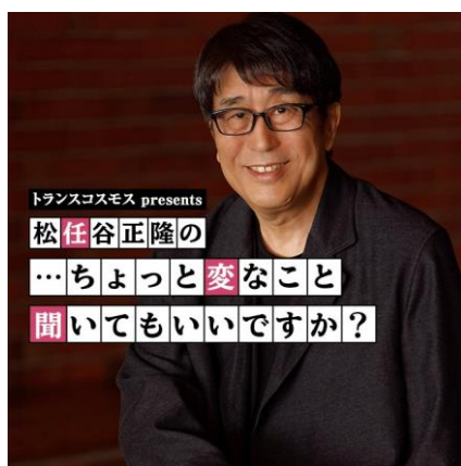
パーソナリティ 松任谷正隆氏

トランスコスモス株式会社(代表取締役共同社長: 牟田正明、神谷健志)は、TOKYO FM とのコラボレーションで、メタバース空間で聴覚・視覚・嗅覚まで楽しむ番組を公開収録。その模様は音楽プロデューサー・松任谷正隆が、毎週、様々な分野のゲストを迎えて新たな魅力に迫る『松任谷正隆の…ちょっと変なこと聞いてもいいですか?』で8月25日(金)9月1日(金)午後5時30分から放送します。