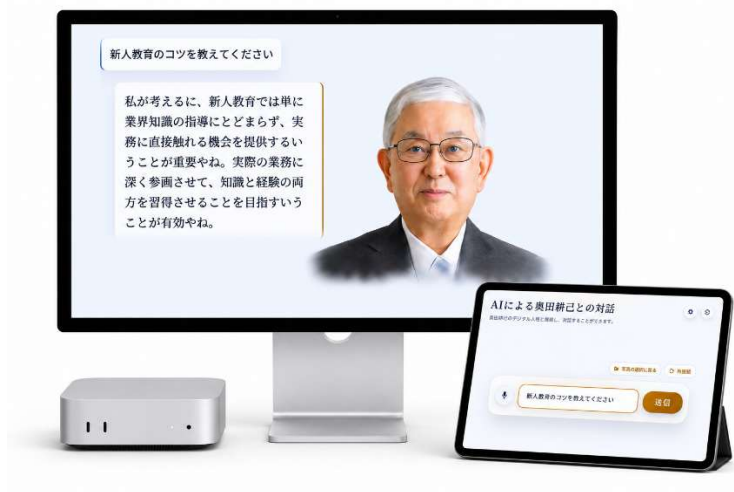
写真 1 枚と講演録から、完全ローカル環境でのリアルタイム対話を実現

トランスコスモスグループの AI コンサルティング会社、マシンラーニング・ソリューションズは、トランスコスモスの創業者（ファウンダー）、故 奥田耕己の理念継承を目的とした人物再現 AI「ファウンダーAI」を開発しました。