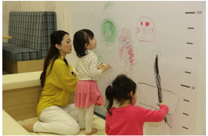
<「Work it! Plaza さっぽろ」キッズスペース>