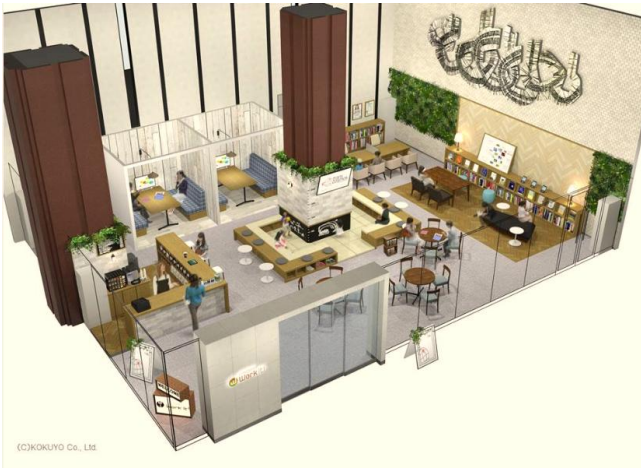
<「Work it! Plaza さっぽろ」全体>