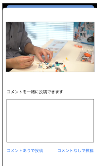
②動画の確認とコメント入力 コメントなしでも投稿可能