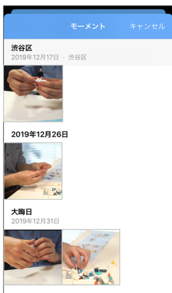
①アップロード対象動画を選択