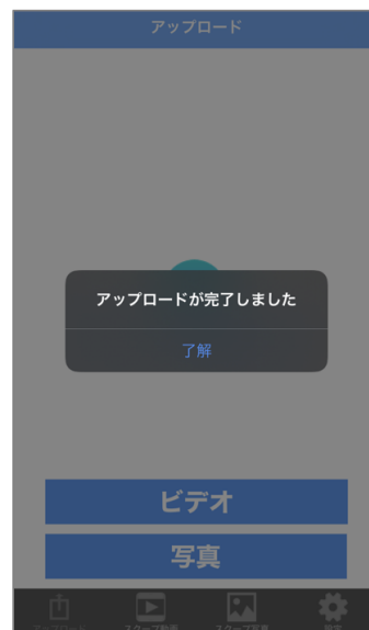
③動画のアップロードが完了

※サービス紹介動画はこちらから( https://youtu.be/HPfXxkEXU_Y )