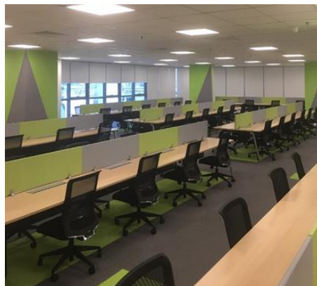
<オペレーションルーム>