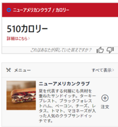
Yext Answersによるサイト内検索結果イメージ

お客様の意図に対して的確かつ、+αの気づきの情報も関連づけた価値の高い情報を表示可能に