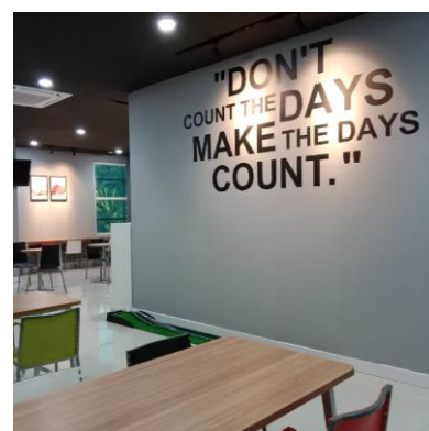
写真:スマラン第二センター

Trust & Safety サービスとは、不特定多数のユーザーによって投稿されたインターネット上のコンテンツ(書き込み・画像・動画)を監視するモニタリング業務(投稿監視)のことです。オンラインコンテンツを監視しリスクを軽減することは、コンテンツの整合性と安全性を確保するうえで非常に重要です。トランスコスモスの専門チームが有人による監視を行うことで、お客様企業のコンテンツをより健全・良好な状態に保ち、企業とユーザーの双方を保護します。