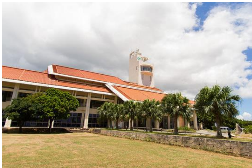
小規模型 BPO センターを開設する宮古島 ICT 交流センター