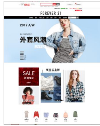
FOREVER 21JD 公式旗艦店