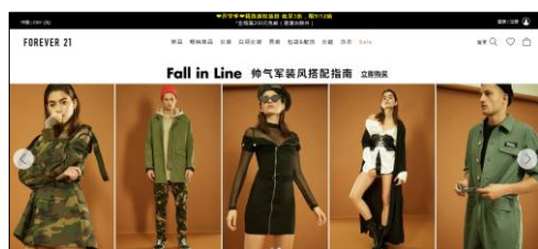
FOREVER 21 中国公式サイト