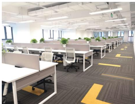
オペレーションエリア