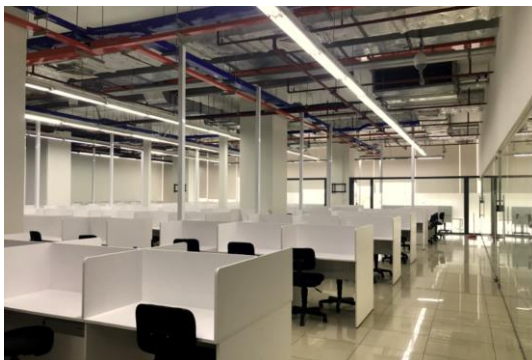
<オペレーションブース>

所在地: ホーチミン市、タンビン区 コンフォア通り 20 Pico Plaza 4階 敷地面積: 800平方メートル 席数: 320席 対応言語: ベトナム語、英語 提供サービス: ベトナム国内向けコンタクトセンターサービス、BPOサービス、デジタルマーケティングサービス