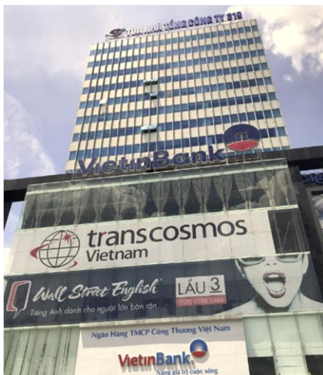
<「ホーチミン第三センター」を開設する Pico Plaza 外観>