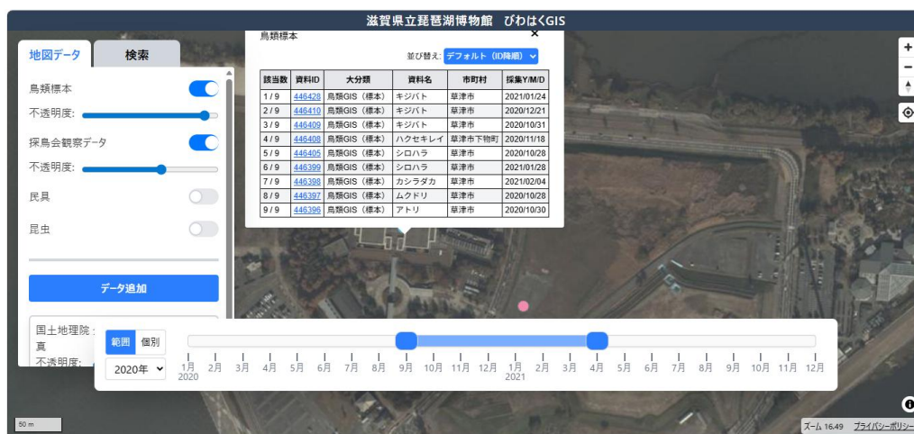
びわはく GIS で、冬に琵琶湖博物館周辺で採集された鳥類標本を表示した様子

※探鳥会観察データは、日本野鳥の会滋賀と滋賀県野鳥の会の会報に掲載されたデータをご提供いただきました。