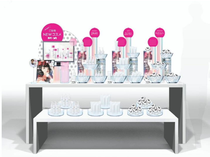
<「ロフト」での販売展開イメージ>