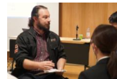
↑ ロールプレイの様子 (イメージ)

「カタカナ接客英語研修」でインプットした知識をロールプレイでアウトプット。外国人とのコミュニケーションに対する苦手意識を減らし、伝わることの楽しさを実感できる研修です。