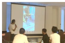
↑ 講評の様子 (イメージ)

(株)かまいしDMC様 「YouTuberが教えるインバウンドに効く！ 簡単情報発信」