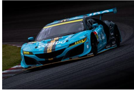
SUPER GT 2023 (GT300) 参戦 「Yogibo Racing」