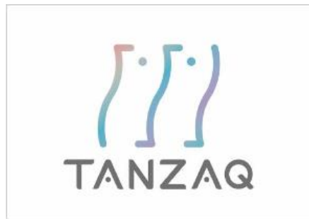
持続的な社会課題解決を目指す広告 「TANZAQ」