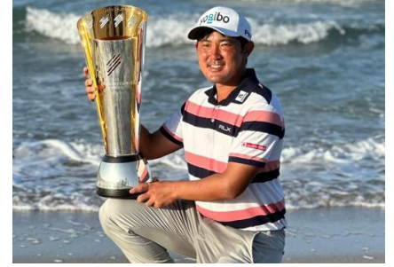
プロゴルファー金谷拓実選手 所属契約