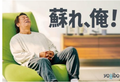
2023 CMイメージキャラクター 長州カさん 起用