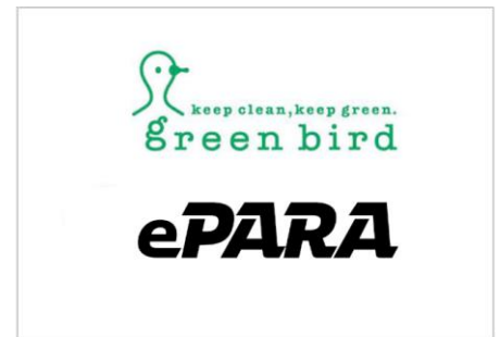
TANZAQ で広告出稿している 社会団体（一部）