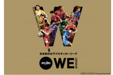
日本初の女性プロサッカーリーグ 「WE リーグ」