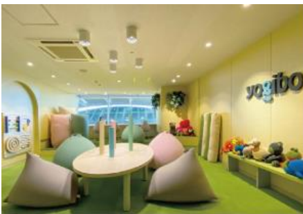
安心してスポーツ観戦できる 「センサリールーム」

【Yogibo Social Good「TANZAQ（タンザク）」： https://tanzaq.jp 】