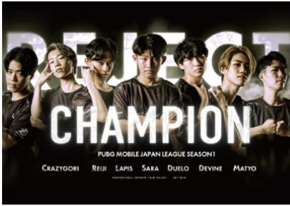
プロeスポーツチーム 「REJECT」