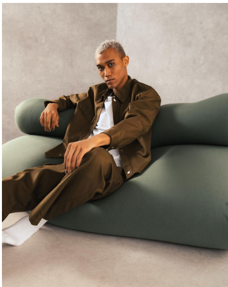
オリーブグリーン

Yogibo Max(ヨギボー マックス)、Yogibo Mini(ヨギボー ミニ)、Yogibo Lite(ヨギボー ライト)、Yogibo Drop(ヨギボー ドロップ)、Yogibo Lounger(ヨギボー ラウンジャー)、Yogibo Pyramid(ヨギボー ピラミッド)など複数のビーズソファシリーズに対応。Yogibo Premiumシリーズ(ヨギボー プレミアムシリーズ)も同時展開し、ライフスタイルや好みに合わせてお選びいただけます。