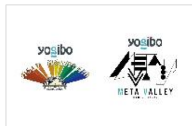
ライブハウスのネーミングライツ取得