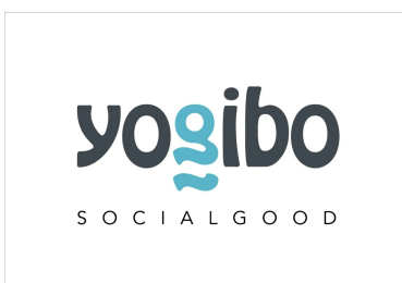
商品売上の5%を社会課題の解決に 「Yogibo Social Goodクーポン」

【Yogibo Social Good「TANZAQ(タンザク)」 : https://tanzaq.jp 】