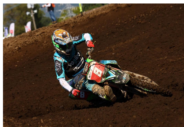
全日本モトクロス参戦チーム 「マウンテンライダーズ」メインスポンサー