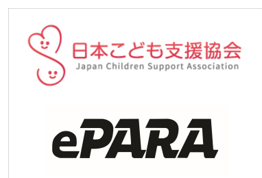
TANZAQ で広告出稿している 社会団体(一部)