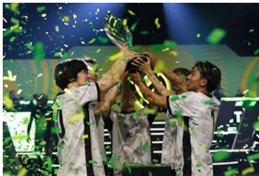
プロ eスポーツチーム「REJECT」

【Yogiboパートナーシップ : https://yogibo.inc/csv/ 】