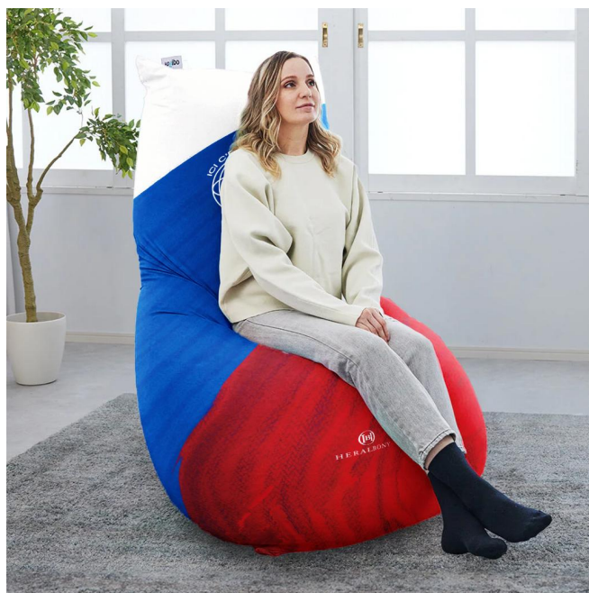
特別デザインのYogiboを会場内に設置