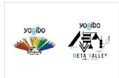
ライブハウスのネーミングライツ取得