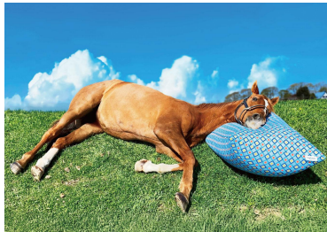
引退競走馬の余生を支援する活動 Yogiboヴェルサイユリゾートファーム