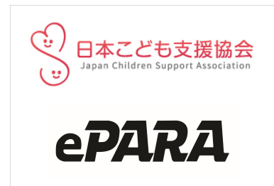
TANZAQ で広告出稿している 社会団体(一部)